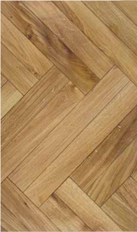
PARQUET OAK WITH BEVELS