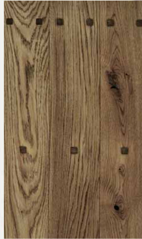
CASTLE BROWN WITH WOODEN NAILS

Solid floor Oak, Ash Landhausdielen Eiche, Esche