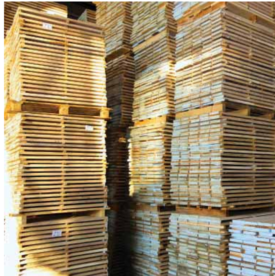
Quality preparation Qualität vorbereitung