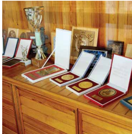
Confirmation of quality Qualitätszertifikat