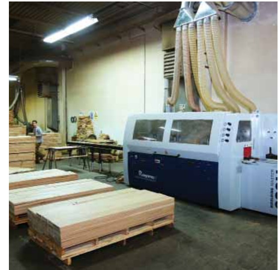
Controlled production Kontrollierte production

Anteros Arctic Black Gold Brown sugar Castle brown Charcoal Cherry coral Chocollate