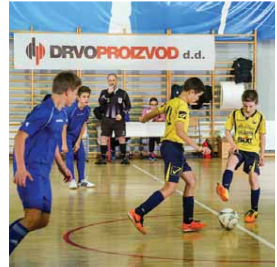
Social responsibility Soziale verantwortung

Insomnia Issa King Mahagony Majestic Melange Monsoon Nicks