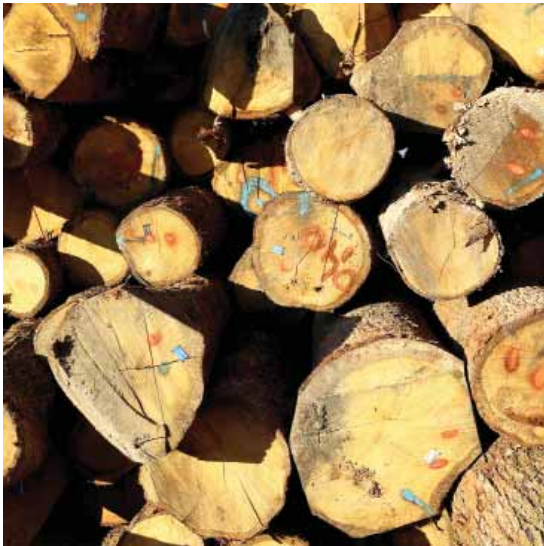
100 % fsc material 100% fsc material