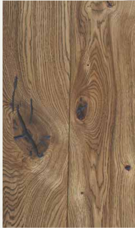
DARK OAK HANDSCRAPE

Solid floor Oak, Ash Landhausdielen Eiche, Esche